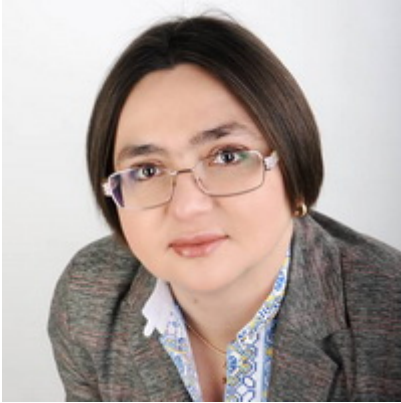
Автор: Вероніка Мовчан,

Таким чином, у географії торгівлі України товарами в 2019 році відбулося декілька визначних змін. Однак наразі не зрозуміло, наскільки сталими вони будуть.